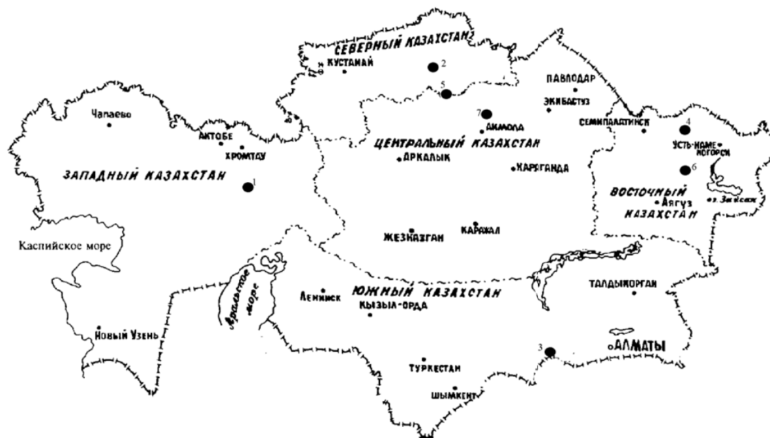
Рисунок 1 – Схема размещения месторождений золото-сульфидно-кварцевого штокверкового геолого-промышленного типа Казахстана

1 – Юбилейное; 2 – Васильковское; 3 – Когадырь; 4 – Секисовское; 5 – Райгородок; 6 – Балажал; 7 – Жолымбет.